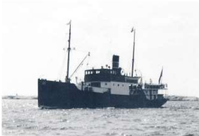
Här kommer s/s BORÖYSUND ångande i solglittret utanför Lysekil på väg mot Göteborg.

Hur som helst, reportern uppskattade vår matsal och dess ångbåtshiff ("en väl tilltagen rygghiff") liksom vår personal