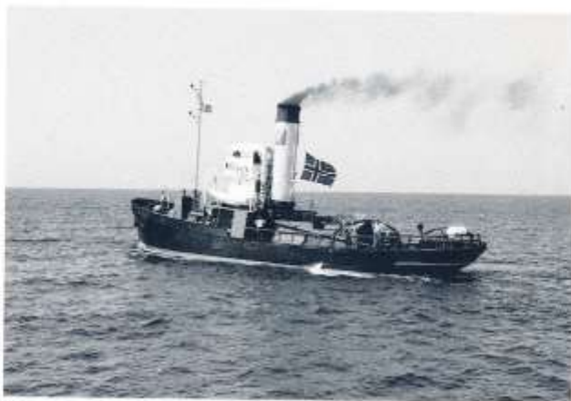
Ångbåtsmötets mest beresta ångare: s/s FORLANDET, valfångaren från Sydpolen med den spartanska kommandobryggan. Här utanför Marstrand.