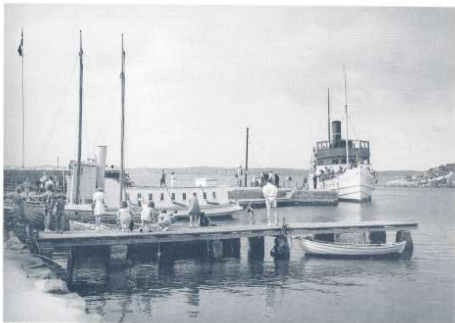
Ångbåtens första riktiga gissningstävling. När ungefär kan fotot vara taget? Var någonstans i Bohuslän? Vad heter fartyget om babord och vart seglar det? Notera småbåtarnas höga master. Skriv till redaktionen och berätta. Stor åra vederfars genom namns publicering ombord i Ångbåten.