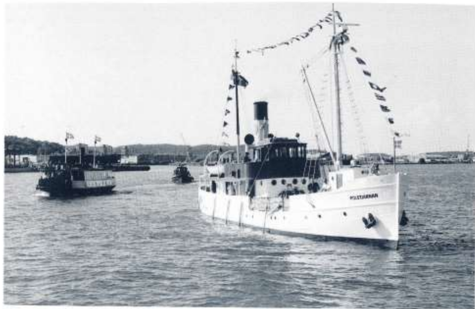
Ångbåtsmötet inleds med den olika fartygens ankomst till Stenpiren. Här anländer s/s POLSTJÄRNAN på sin långa segling från Karlstad eskorterad av FARJAN 4 och STORMPRINCESS.

Med anledning av att BOHUSLÄN fyllde åttio år 1994 hade man beslutat att 1994 års ångbåtsmöte skulle äga rum i Göteborg den 8 - 10 juli.