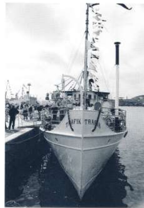
En fin 102-åring förfraån: s/s TRAFIK från Hjo vid Stenpiren på ångbåtsmötet.

Det yngsta fartyget var bogserbåten m/s HERKULES byggd 1939 i Landskrona för C.L. Hans-