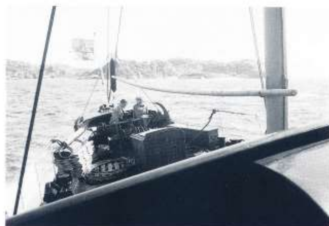
En fin bild från 1938. BOHUSLAN i god gång över en lite gropig Malmöfjord söderöver. Kornbarna föröver. Flera detaljer att noga studera för den noggranne.

Med ett fast grepp om kläderna genom det välkända blåshålet vid residenset kunde vi fortsätta till Stenpiren, där s/s BOHUSLAN låg och väntade på oss. Troligen inte bara på oss men det var inte precis någon folk-