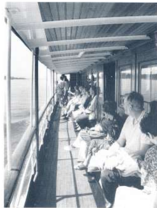
Ångbåtsfrid. Sommar ombord i BOHUSLÄN någon- stans, där hon saktat farten. Resan har varit någon timma och våra passagerare njuter av luften ombord.

Möt junis ljus på Käringön! Strax före midsommar seglar vi