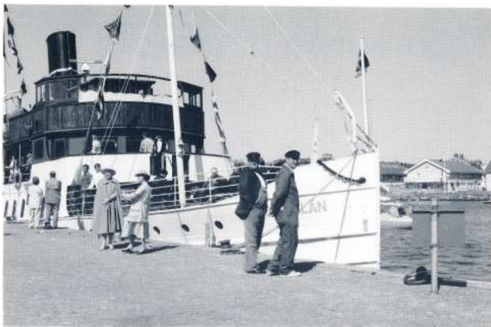
Åsbbånn och Slummer-Ville på utflykt till Marstrand? Nej, två av besättningen råkar komma framför kameran medan damerna i bakgrunden ger en lätt trettioårsstämning åt bilden.

dit liksom en tur i mitten av augusti. Från öns högsta del har man en fantastisk utsikt över havet och omgivande skärgård. Badmöjligheterna är obegränsade.