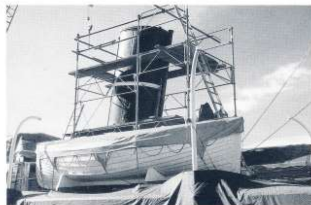
Vårupprustning hos Gothenius. Skorstenen målas.

Skotten och fönsteromfattningarna jämte dörrarna fick samma behandling och den fina teaken lyser nu i sin härliga glans och bör stå sig i flera år