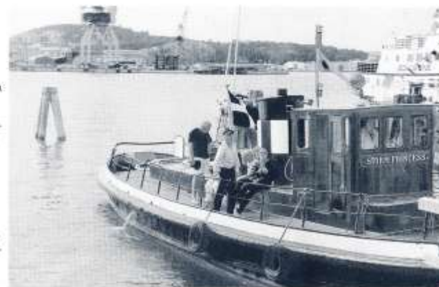
STORMPRINCESS under ångbåtsmötet 1994. Foto: Bo Starmark.

Istället för den lilla plåtstyrhytten fick hon en större i teak. Hon fick också ett nytt kvistfritt oregonpinedäck. Den manuella