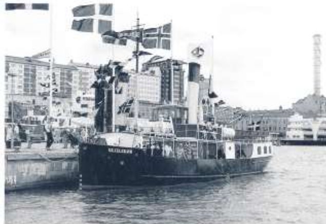
Våra kära danska vänners s/s SKJELSKØR hade fått en fin plats på Stenpirens kortända.

Den 12 juli hade Filipstads Tidning ett stort reportage, där man kunde berätta om att Karlstad gästades av "Göteborgarnas stolthet s/s Bohuslän, norska koleldade s/s Böröysund, s/s Trafik, välkänd Vätterbåt, s/s Ornen av Stockholm och lilla privatångaren s/s Nalle". Naturligtvis imponerades man av entusiasmen ombord ("samtliga ställer upp utan lön, jobbar för att det är kul") - helt självklart för Ångbåtens läsare men